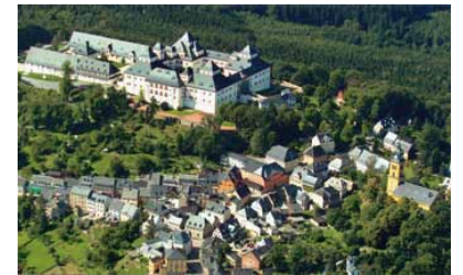
Blick auf Stadtzentrum Augustusburg