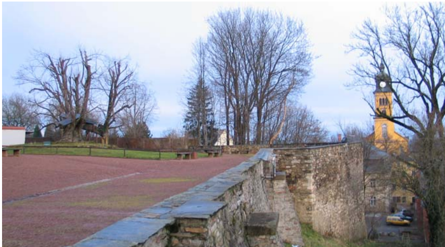
Blick auf die Schlossmauer mit Schlosslinde (nach Überlieferung Pflanzung 1421)